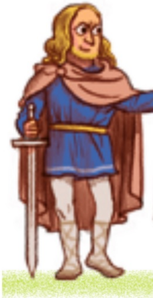
Clotaire II 584 - 629

Cette image est issue d'Images Doc n° 313, janvier 2015.