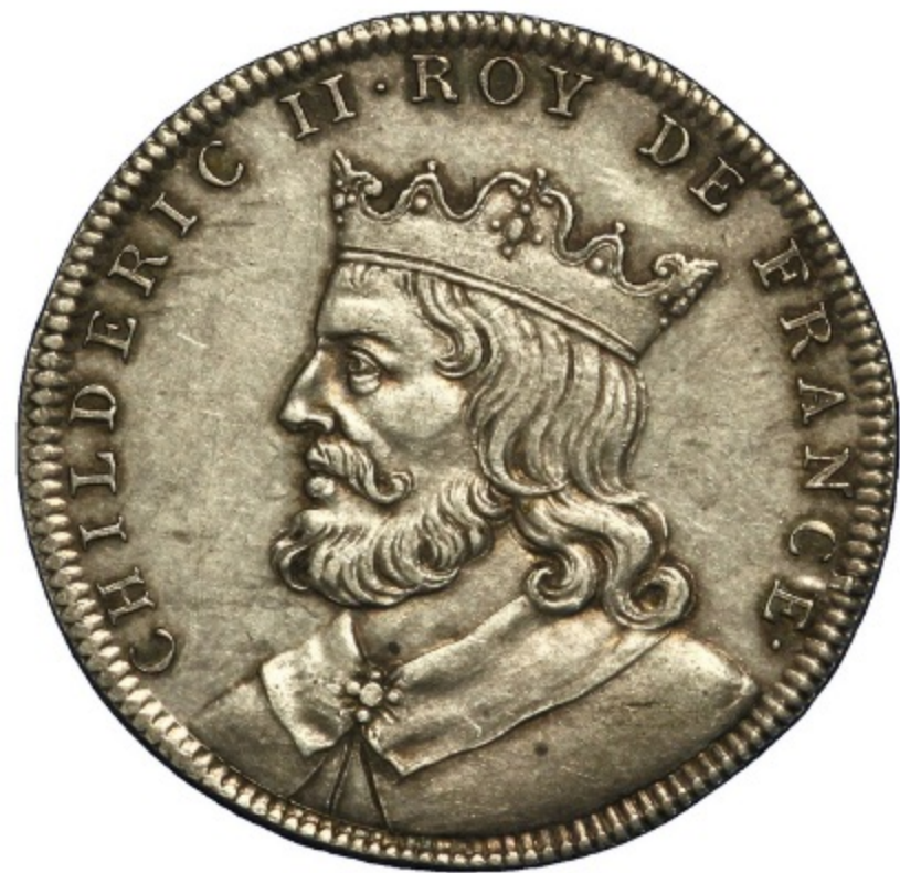
Buste imaginaire de Childéric II

Cette image est issue d'Images Doc n° 313, janvier 2015.