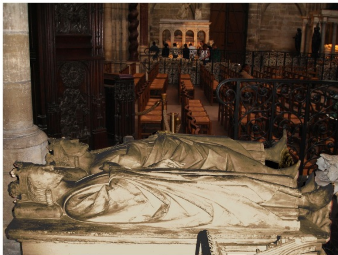
Gisants de Clovis II (premier plan) et Charles Martel (second plan) à la basilique Saint-Denis. Vue d'artiste (xiii e siècle).

Cette image est issue d'Images Doc n° 313, janvier 2015.