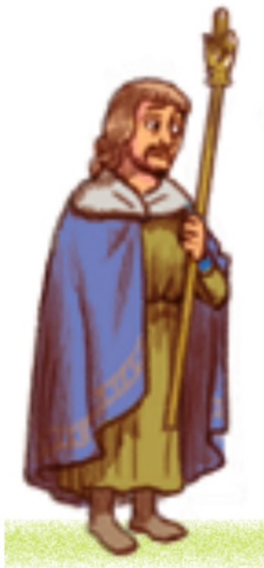
Clovis II 635 - 657