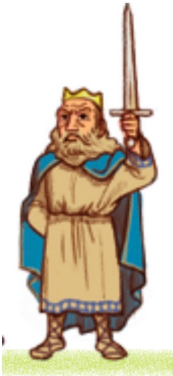
Clotaire I er 497 - 561

Cette image est issue d'Images Doc n° 313, janvier 2015.