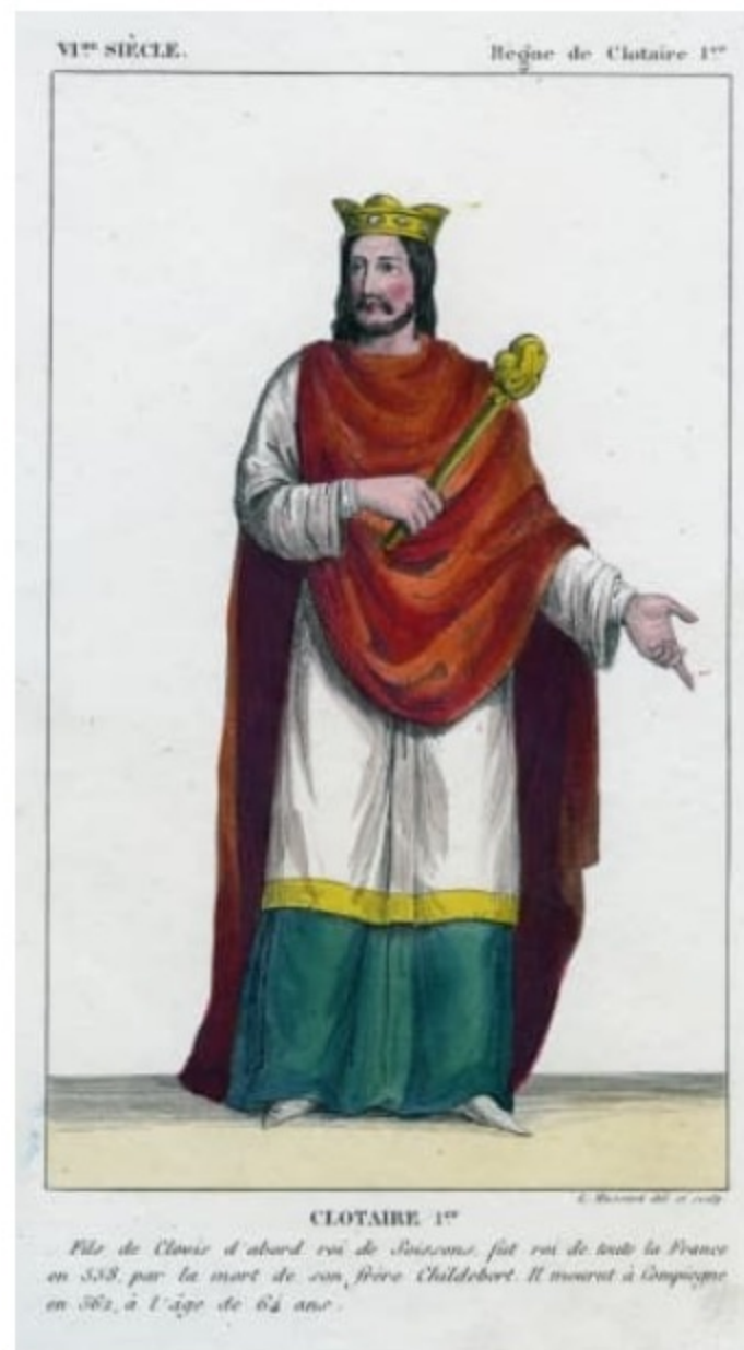
Fils de Clovis, il est d'abord roi de Soissons (511) avant de devenir maître du royaume franc (558). Gravure colorée.

Cette image est issue d'Images Doc n° 313, janvier 2015.