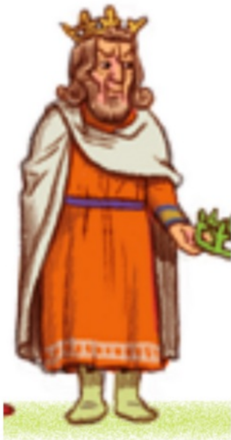
Thierry III 654 - 695